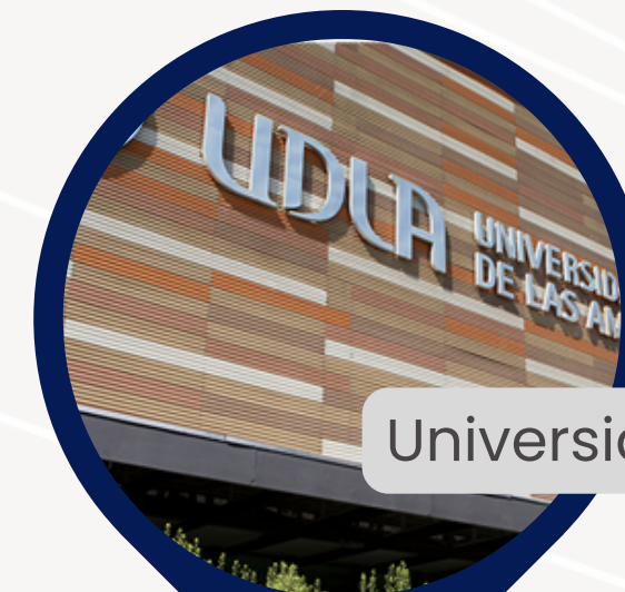
Universidad de Las Américas Av. Pdte. Jorge Alessandri Rodríguez 1160