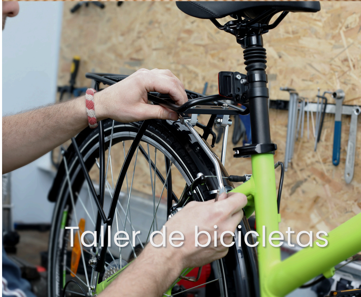
Taller de bicicletas