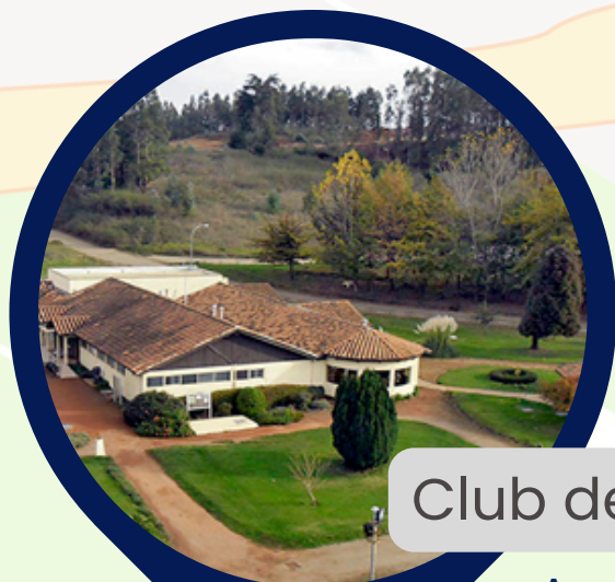
Club de campo Bellavista Av. Campos deportivos 640