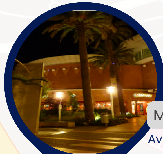
Mall Plaza El Trebol Av. Pdte. Jorge Alessandri Rodríguez 3177