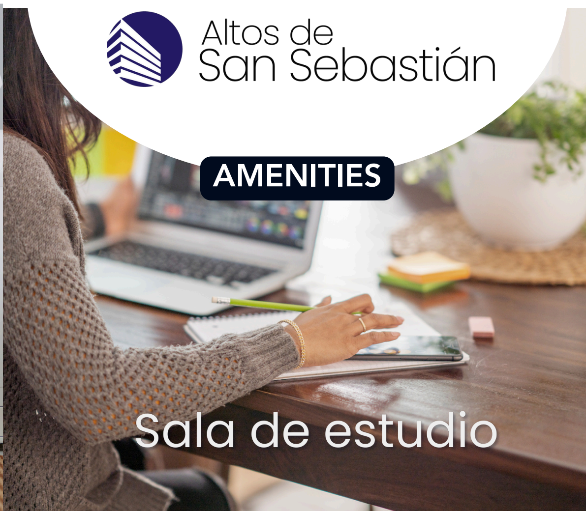
Sala de estudio