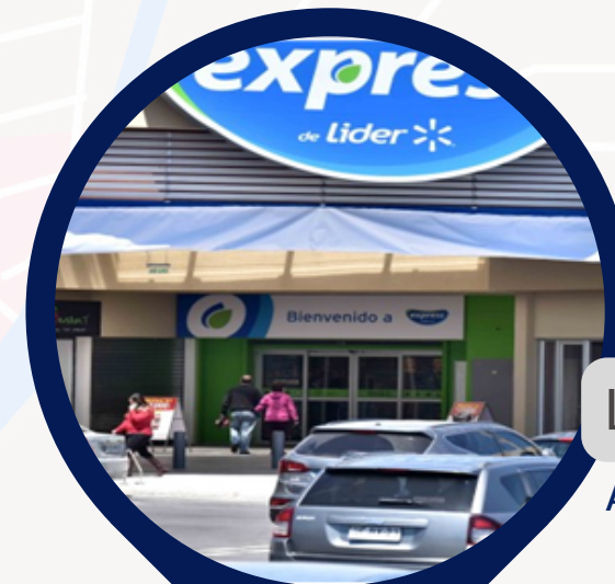
Líder Express Av. Bellavista 1273