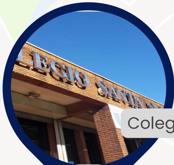
Colegio Santa Sabina Lleuque 1477